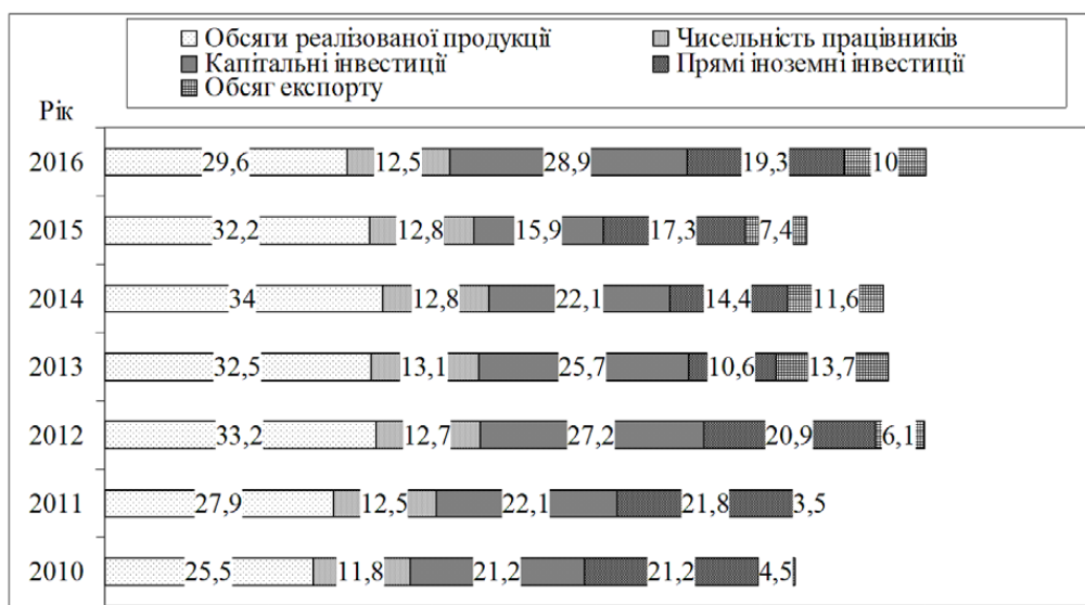
Рис. 1. Внесок підприємств харчової промисловості у загальнопромислові показники Львівської області за 2010-2016 рр. (%)

Разом із тим зріс обсяг продукції на підприємствах з виробництва м'яса та м'ясних продуктів, із