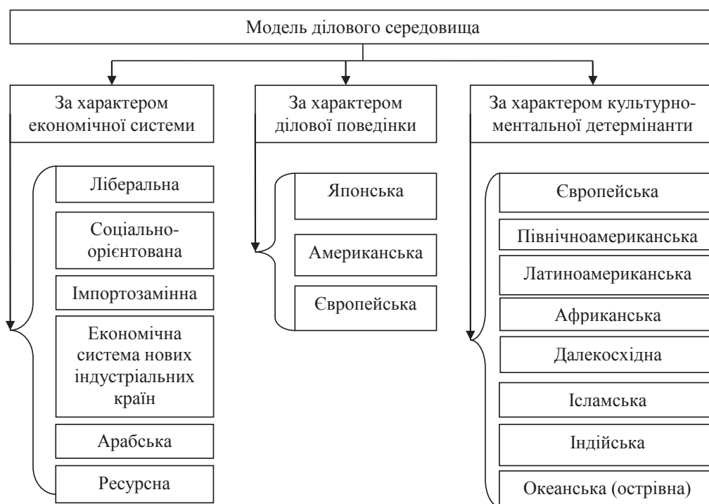
Рис. 2. Класифікація сутнісних ознак диференціації моделей ділового середовища

Вважаємо за доцільне запропонувати авторську класифікацію сутнісних ознак диференціації моделей ділового середовища. А також запропонуємо власну класифікацію національних моделей, виходячи з уже окресленої нами у визначенні поняття моделі ділового середовища цивілізаційно-ментальної детермінанти. Умовно моделі ділового